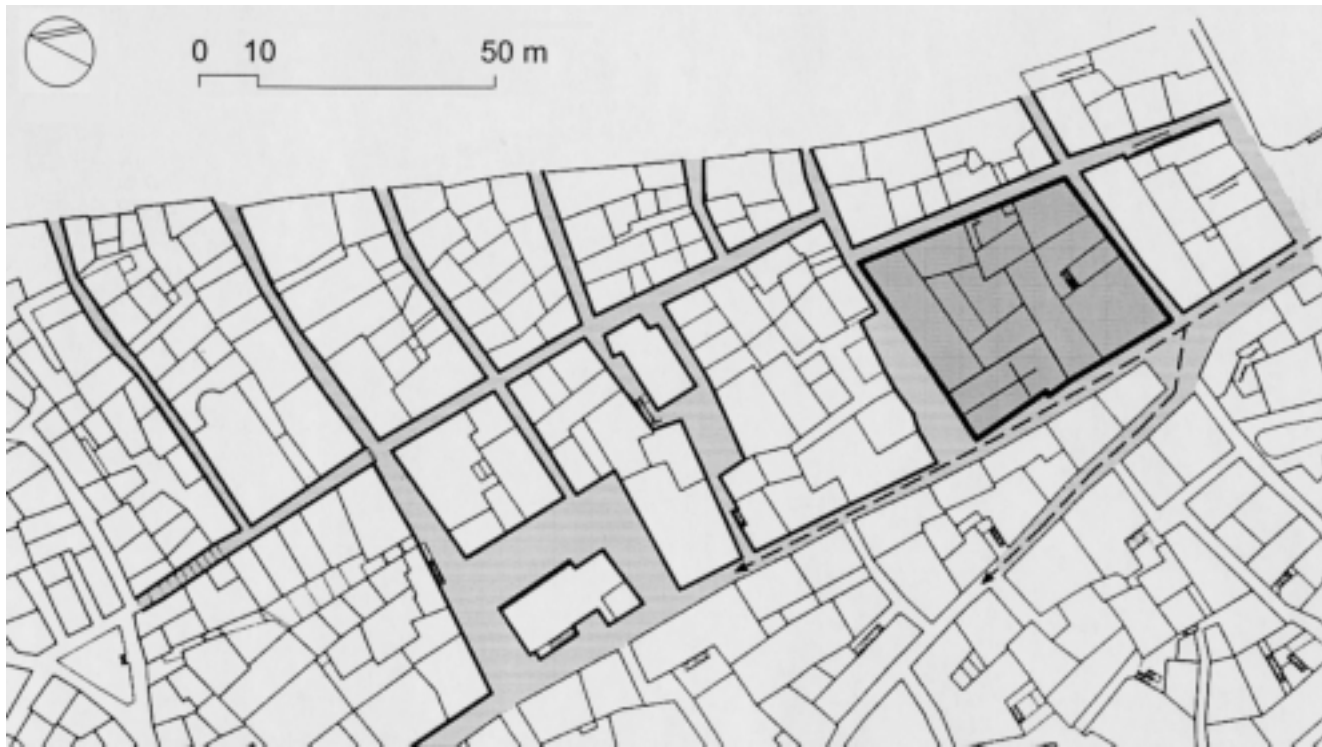
Blok Sv. Spasa u odnosu na urbanističku strukturu i komunikacije na Gorici

Block of the Holy Saviour in relation to the urban structure and communications' scheme of Gorica, a part of medieval town of Šibenik