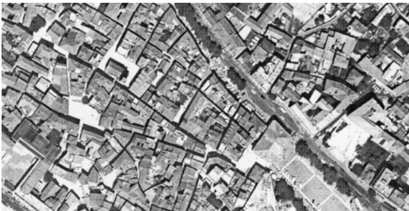
Šibenik, zračna snimka dijela povijesne jezgre, u sredini blok Sv. Spasa – izvorno templarski castrum Šibenik, aerial view of the part of medieval town with the block of the Holy Saviour, originally the seat of Templar Knights

but naselja koje nije biskupsko sjedište. Dio tog naselja bila je i utvrda – kaštel Sv. Mihovila (na položaju današnje tvrđave Sv. Ane) – koja se izričajima onovremenog latiniteta nije mogla imenovati nikako drukčije nego također castrum . Pojam castrum kao oznaku pravnog statusa naselja treba dakle razlikovati od oznake za kaštel, tj. utvrdu u užem smislu.