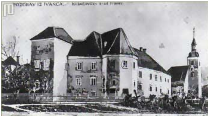
Kukuljevićev grad na snimci iz 1896. godine

kaštel iznova gradila. Konačni oblik kaštelu dala je obitelj Kukuljević – Sakcinski u XIX. stoljeću, točnije Ladislav Kukuljević – Sakcinski pa se u narodu uvriježio naziv Kukuljevićev grad. Kukuljevićev grad spaljen je 1943. godine, a zadnje kule dvorca, spomenika ivanečke prošlosti, srušene su 1959. godine ne bi li se, po ondašnjim mjerilima, prostor bolje prilagodio novozamišljenom urbanističkom skladu.